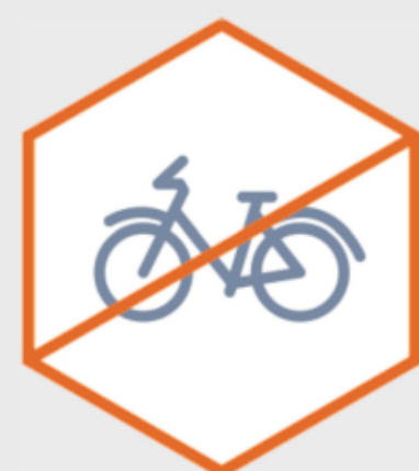
Aizliegts izmantot skeitparku ar neatbilstošiem braucamlīdzekļiem