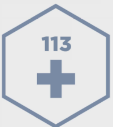
nelaimes gadījumā zvanīt 113

Nepieciešamības gadījumā rakstiet vai zvaniet ikšķiles novada pašvaldībai tālr.: 65030202 e-pasts: dome@ikskile.lv Reģionālā pašvaldības policija, dežurdaļas tel.nr. 67937102