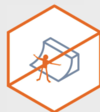
Aizliegts traucēt citiem skeitparka apmeklētājiem