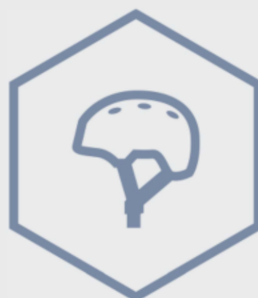
obligāti jāizmanto aizsargķivere