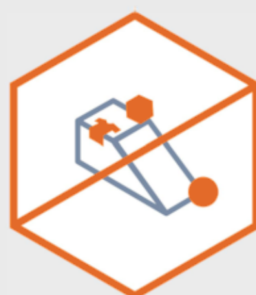
Atstāt somas, apģērbu vai citus priekšmetus uz skeitparka konstrukcijām