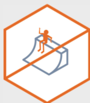
Sēdēt un drūzmēties uz konstrukcijām