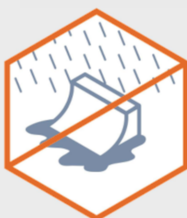
Lietot skeitparku nepiemērotos laika apstākļos