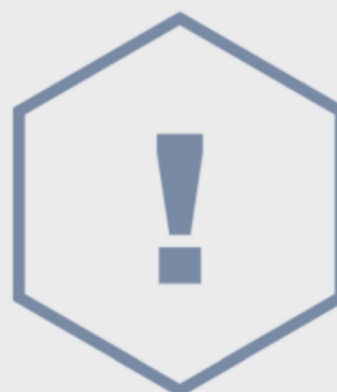
skeitparku sporta veidi ir saistīti ar paaugstinātu risku